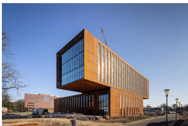
Figuur 2