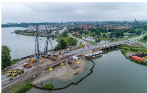
Figuur 1 Gemaal Monnickendam

Voor het gemaal van Monnickendam is gunningsvoordeel verkregen voor de CO2 prestatieladder. Binnen dit project is samen met van Hattem en Blankevoort een CO2 projectplan opgesteld. Gezamenlijk is gekeken hoe er op het project CO2 kan worden bespaard. De maatregelen zoals groene stroom, energiezuinige bouwketen, carpools, elektrisch materieel (waar mogelijk) sluiten aan bij de bedrijfsmaatregelen.