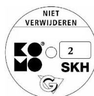
geschikt voor weerstandsklasse 2